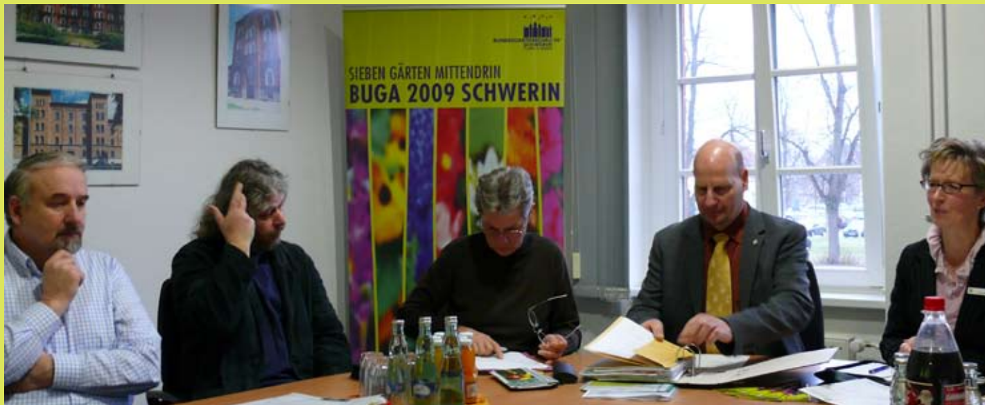
Treffen der Projektträger aus dem Landkreis Parchim

BUGA-Außenstandorte entwickeln Ideen- Landkreis Parchim bringt sich ein