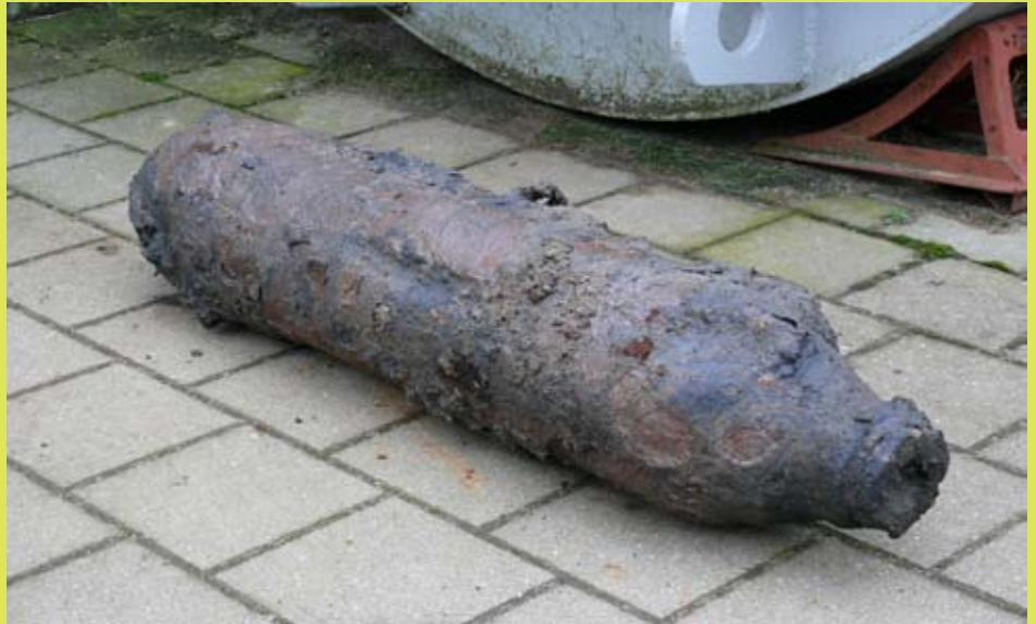
Ein schwerer Fund - Eine Bombe aus dem 2. Weltkrieg

So fanden sich neben vielen Fachwerkbalken auch noch die alten Straßenschilder der Salzstraße und des Großen Moores. Blech- und Keramikgeschirr, Nachttöpfe und Flaschen wurden aus der Tiefe geholt.